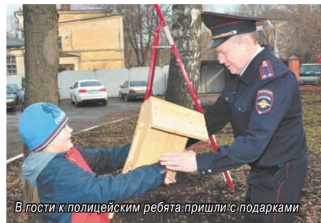
В гости к полицейским ребята пришли с подарками

Воспитанники детского сада № 129 побывали в гостях у томилинских полицейских.