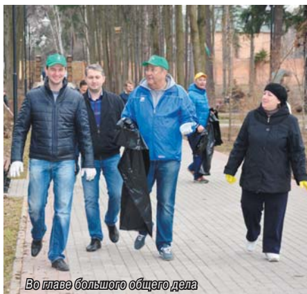
Во главе большого общего дела