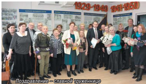
Поздравление – славной труженице