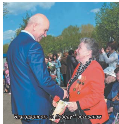
Благодарность за Победу – ветеранам

К празднику Великой Победы в Томилино пройдут встречи представителей власти и общественности с участниками войны и тружениками тыла, торжественные митинги у воинских мемориалов, праздничные концерты. Ветеранам Великой Отечественной войны из местного бюджета будет выделена материальная помощь.