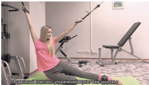
Специальный комплекс упражнений вернет вам здоровье