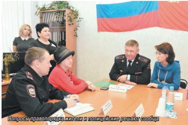
Вопросы правопорядка жители и полицейские решают сообща

В Томилино полицейские и общественность договорились о взаимодействии в вопросах общественного порядка.