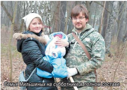
Семья Мильшиных на субботнике в полном составе

В Томилино участие в экологических акциях всей семьей – добрая традиция. Особенно приятно, что ее поддерживают молодые люди.