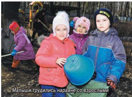
Малыши трудились наравне со взрослыми

Участниками регионального субботника «Чистое Подмосковье. Сделаем вместе» стали воспитанники и воспитатели детского сада № 49.