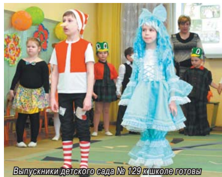
Выпускники детского сада № 129 к школе готовы

В детском саду № 129 прошло районное методическое объединение педагогов, посвященное выпуску детей в школу.