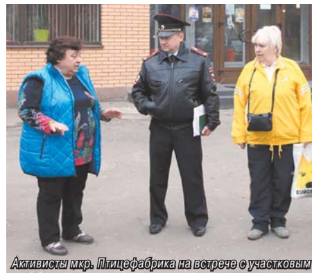
Активисты мкр. Птицефабрика на встрече с участковым