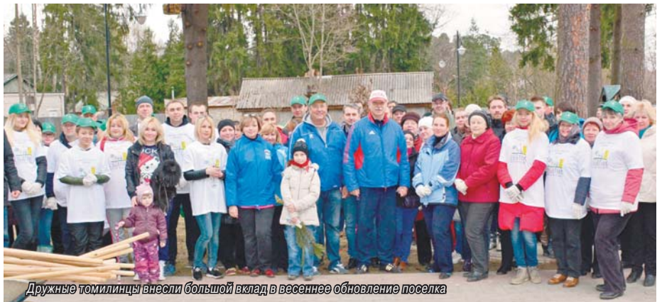
Дружные томилинцы внесли большой вклад в весеннее обновление поселка

В региональных экологических акциях «Чистое Подмосковье», которые по призыву губернатора А.Ю. Воробьева прошли 8 и 22 апреля, приняли участие многие томилинцы. Активные жители поселка, работники административных и муниципальных предприятий, представители общественных организаций, члены местного отделения политической партии «Единая Россия» посвятили два выходных дня благоустройству родного поселка. Все они сделали большое доброе дело: внесли свой вклад в весеннее обновление своей малой родины!