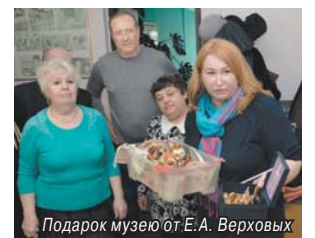
Подарок музею от Е.А. Верховых